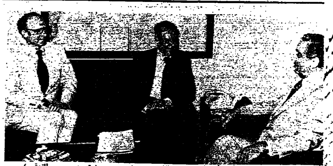
خلوة الرئيس سركيس والوزير فانس والسفير بلركر